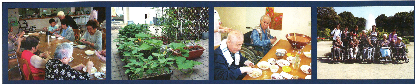
おやつクッキング クレープ