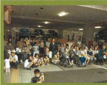
和太鼓演奏会 外にもかかわらず、たくさんの方が 集まってくれました。