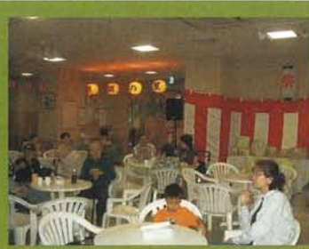
1F フロアー 休憩コーナー