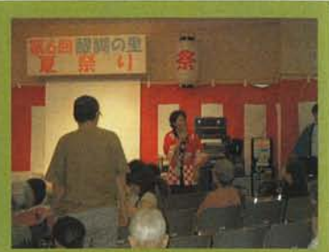
第6回 醍醐の里 夏祭り 開会式