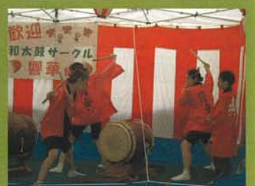
響華 (和太鼓サークル) 演奏会