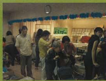
模擬店 (バザー) 売り上げは、利用者の為に活用いた します。