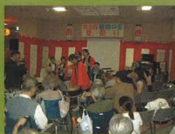
響華 (和太鼓サークル) 利用者の方に、和太鼓に触れあって いただきました。