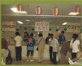
模擬店 食べ物コーナー