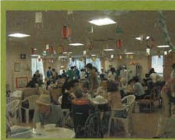
2F フロアー 休憩コーナー