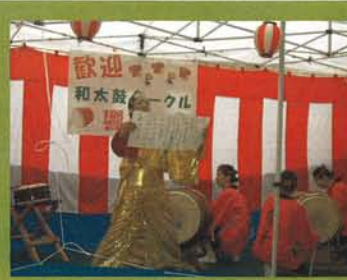
響華 (和太鼓サークル) はじまりのあいさつ